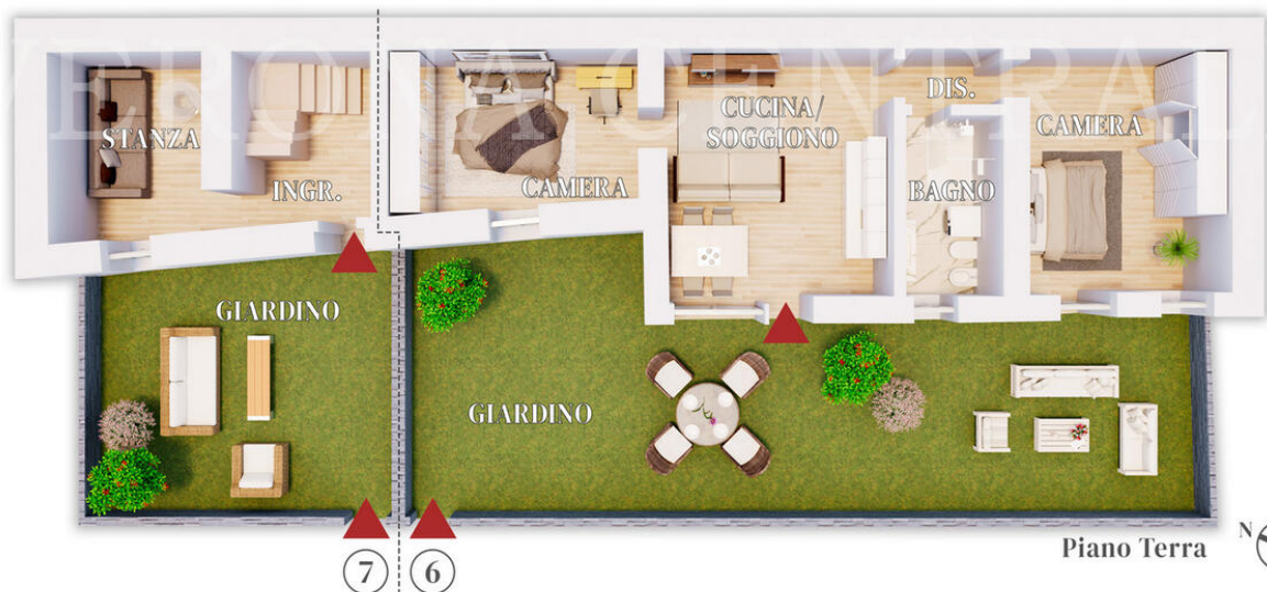
Piano Terra | N